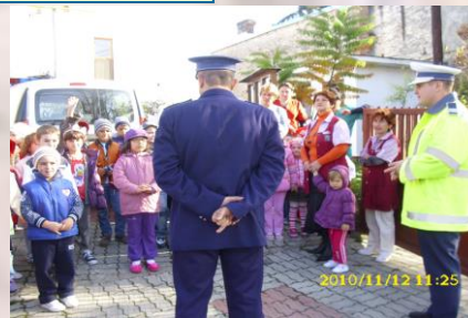
Grupa 1 Subgrupa 5 Brasov