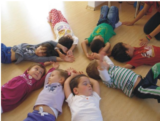
„HRANA SANATOASA, VIATA ARMONIOASA”